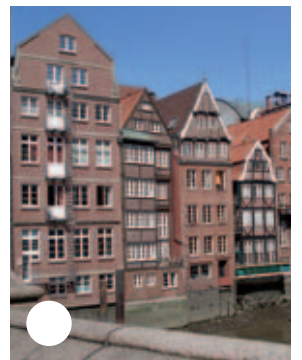
Fachwerkhäuser in der Deichstraße